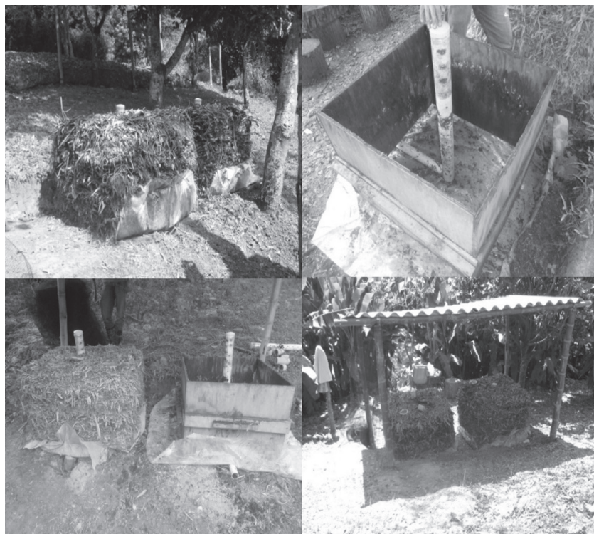
Figura 1. Construcción de las pacas 1 y 2 sin techo, pacas 3 y 4 con techo, Colegio Conquistadores, febrero 2011.

cubierto por los desechos (1 metro); al resto del tubo (50 cm) que sobresalía no se perforó, y se instaló, en el extremo, tapón de PVC para evitar escape de gases. Luego, se colocó una prensa de madera sobre el plástico; día a día se pesaban los desechos y se depositaban dentro de la prensa, y eran simultáneamente pisados hasta obtener la medida de un metro cúbico. Las pacas se clasificaron en 1-2, ubicadas a 30 cm una de la otra y expuestas al sol; y las 3-4 ubicadas a 120 cm con relación a las pacas 1-2, y también conservaron 30 cm de distancia, cubiertas con un techo de Eternit a una altura de 2 m (figura 1).