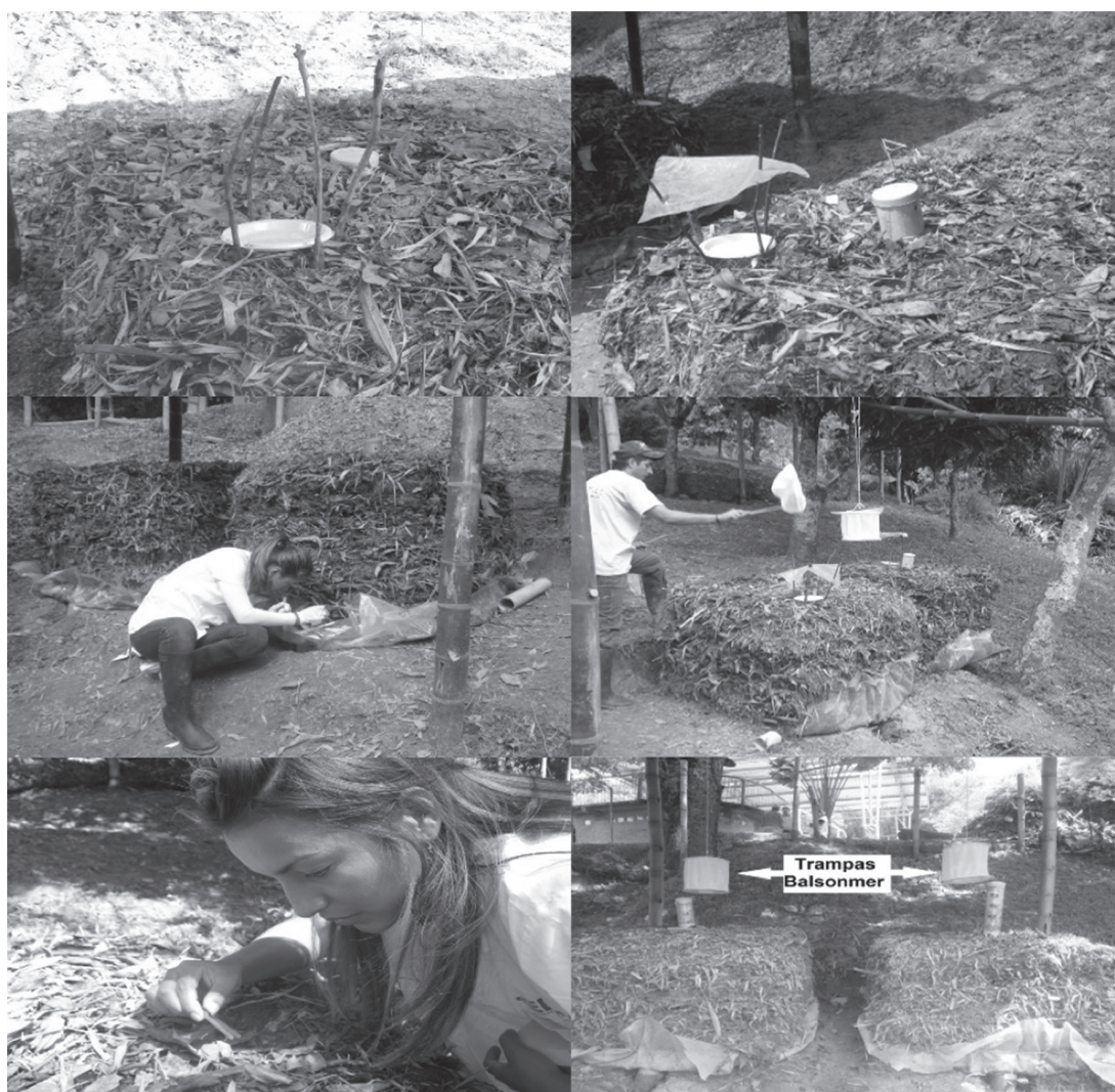
Figura 2. Métodos de muestreo entomológico en las pacas, febrero-junio de 2011.

Se realizó captura e identificación de artrópodos con trampas, según periodicidad indicada en tabla 1, con trampas de aceite mediante platos plásticos de 15 cm de diámetro de color amarillo y blanco impregnados en aceite de ricino, jama, captura manual, trampas Balsolmer y trampas de feromonas para cucarachas (figura 2).