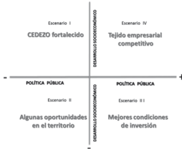
Gráfico 2. Condiciones de importancia y de gobernabilidad

que, de manera coordinada, se definan para el largo plazo los criterios fundamentales de estos escenarios, para el programa.