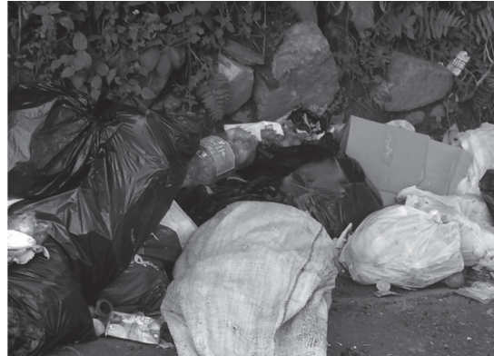
Fotos 1 y 2. Registro de los principales temas tratados por el curso de GA (CHQM, MRSB)