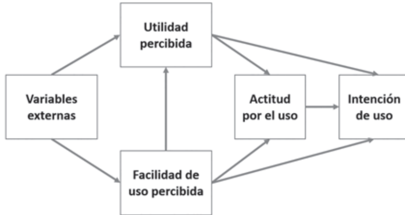
Figura 1. Formulación inicial de TAM (Davies, 1989)

“grado por el que una persona cree que usar un determinado sistema estará libre de esfuerzo” (Davis, 1989, p. 320).