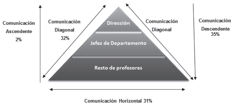
Figura 1. Flujos de comunicación en los centros educativos

de los profesores con el fin de generar una estrecha relación entre los mismos y que sea conocedora de las percepciones y problemas de los profesores. Dentro de este grupo las herramientas más relevantes son el intercambio de información cara a cara (25 %), reuniones tanto formales como informales, teléfono y a través de mensajes a móviles (13 %).